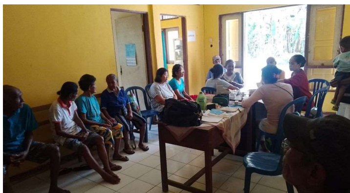
Een clinic gehouden door een medisch team uit Ambon.

Buro Pro-kumpulan wil zich daarom inzetten om de gezondheidspost in 2024 te helpen aan een kleine zonnestroominstallatie, zodat naast stroom voor de verlichting ook stroom is voor de medische koelbox en alle andere medische apparaten en hulpmiddelen.