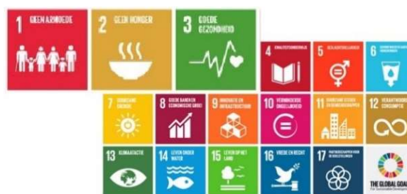
Bron: VN Duurzaamheidsdoelen 2030

Buro Pro-kumpulan en YMLA zetten zich daarom in om samen met de dorpsgemeenschap van Aboru deze drie SDG's na te streven en in ook 2030 te halen. Buro Pro-kumpulan en YMLA kunnen dit echter niet alleen doen en vragen daarom om uw betrokkenheid en steun.