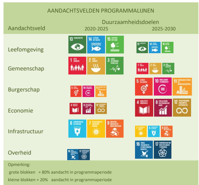
Figuur 4. Aandachtvelden voor de ontwikkeling van de programmalijnen

vaardigheden, en ervaringskennis voor het opschalen van de ontwikkelde duurzame aanpak van lokaal naar regionaal niveau ook