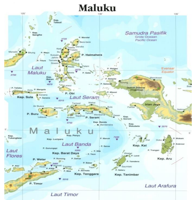
Figuur. Topografische kaart Oost Indonesië.

Het lukt de provinciale overheid op Molukken 4 nog steeds niet om de complexe problemen 5 van kwetsbare groepen in de samenleving aan te pakken. Ze missen de vereiste kennis en expertise om complexe problemen te onderzoeken, oplossingen daarvoor te bedenken, en deze in een beleid om de regio op een duurzame wijze te ontwikkelen om te zetten. Lokale gemeenschappen krijgen daarom vaak van hun bestuurders te horen, dat er geen geld is als zij met plannen komen om hun leefomstandigheden te verbeteren. Om de plannen toch te kunnen realiseren wordt daarom regelmatig een beroep gedaan op individuen of kumpulans in Nederland om te helpen. Daarbij gaat het