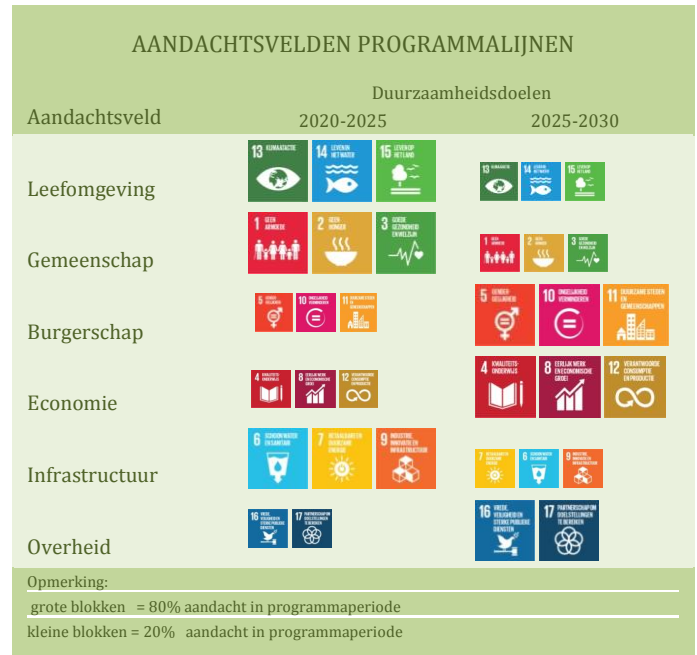
Figuur 1. Aandachtsvelden voor de ontwikkeling van de programmaliijnen

Het streven om de huidige leefomgeving en leefwijze in Molukse wijken te veranderen in een sociaal duurzame leefomgeving en leefwijze valt ook onder deze zienswijze, en daarom zijn de 17 duurzaamheidsdoelen van de Verenigde Naties als context geschikt voor de realisatie van deze duurzame veranderingen in de Molukse wijken (zie pictogrammen in figuur 1).